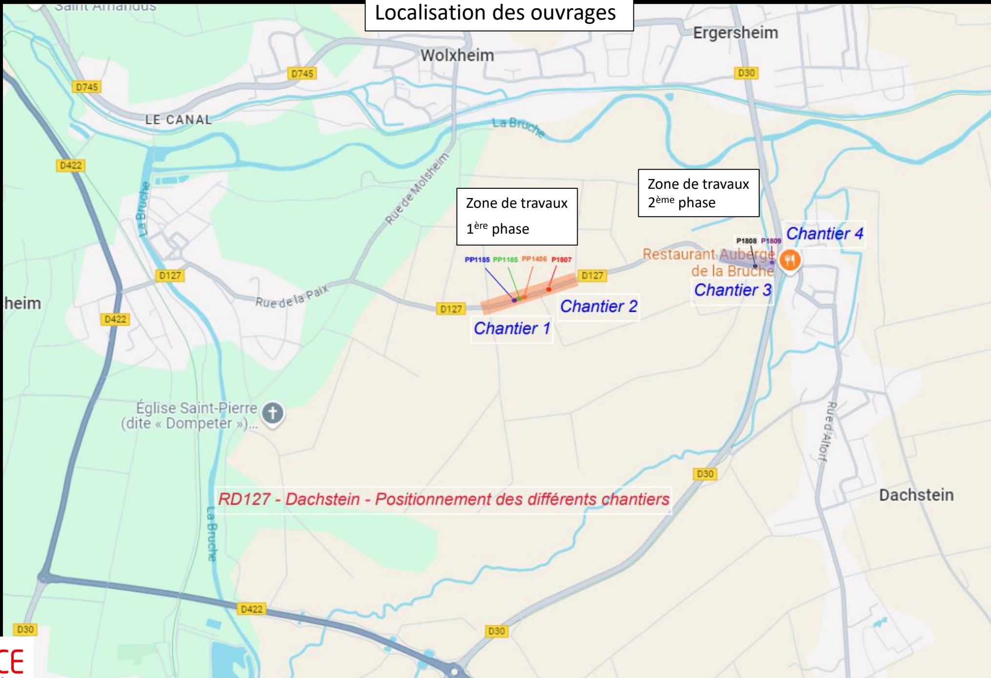
RD127 - Dachstein - Positionnement des différents chantiers